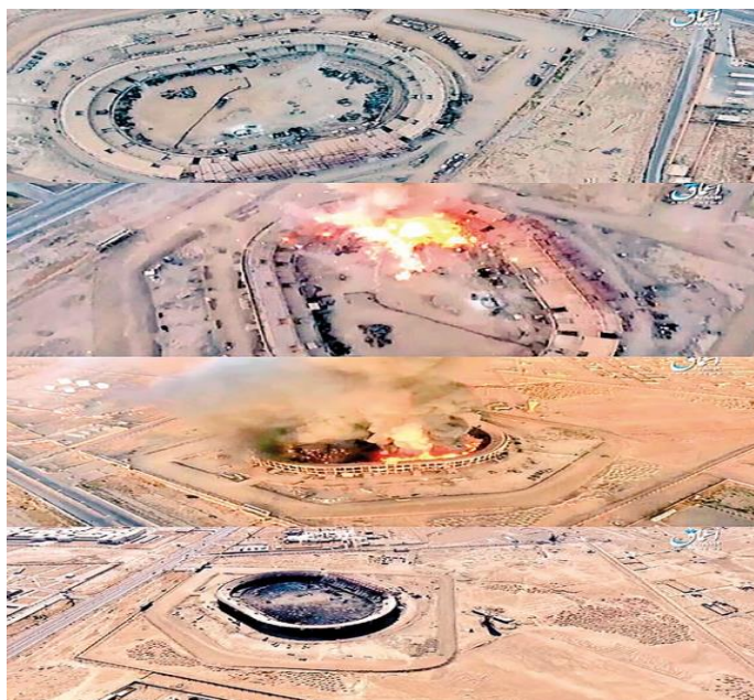
Рис. 2. Последствия применения БПЛА в Дейр-эз-Зоре в 2017 году

Таким образом, первоочередные практические рекомендации командирам не прикрытых средствами РЭБ и ПВО элементов системы связи для повышения защищенности личного состава и объектов хранения боеприпасов от БПЛА можно сформулировать следующим образом: