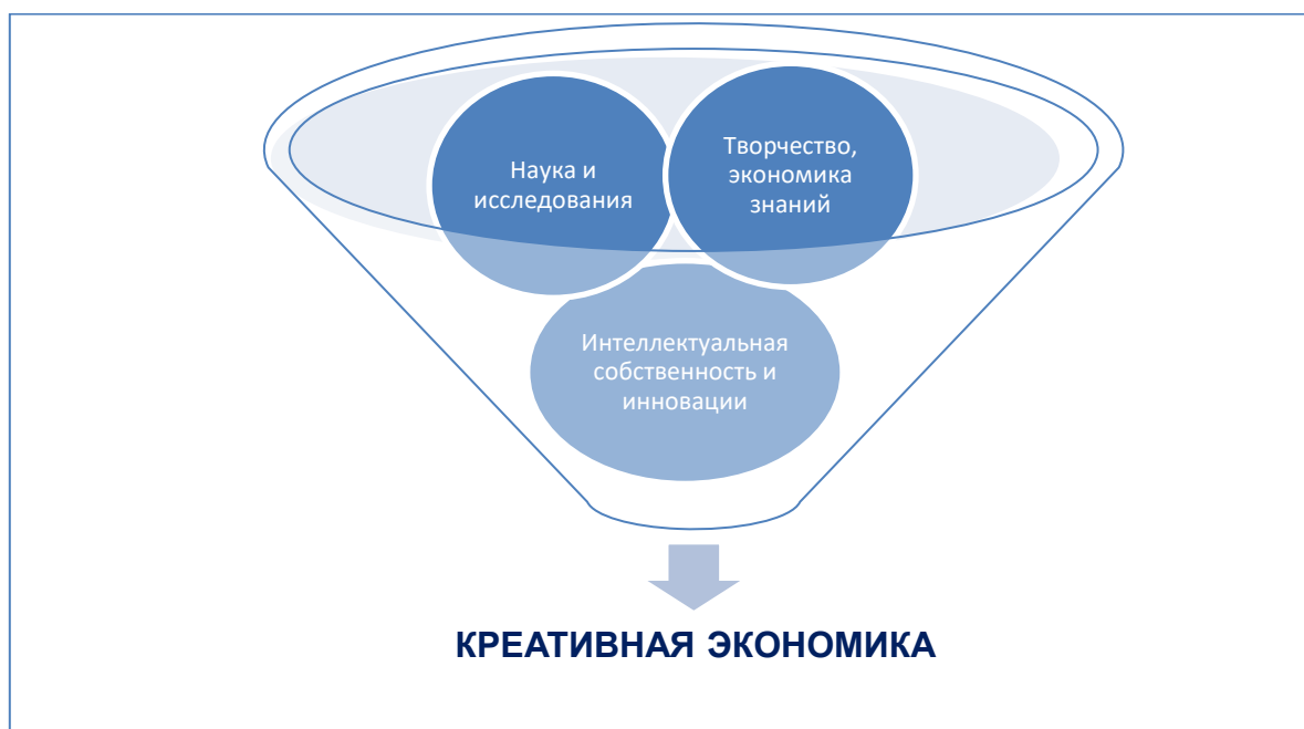
Рисунок 1. Составляющие креативной экономики

Доходы от данной деятельности в 2019 году в мире составили 2,3 трлн. долл. США. Но не смотря на это, до сих пор не выработан единый реестр, что нужно относить к данной индустрии. Например в Великобритании в 2015 году к креативной индустрии были отнесены отрасли, которые основаны на использовании интеллектуальной собственности: